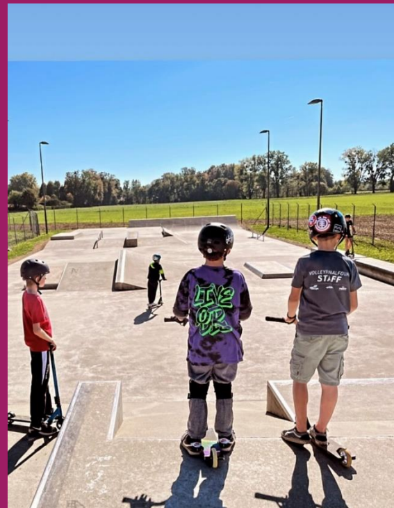
📍 SKATEPARK DE COLOMBIER